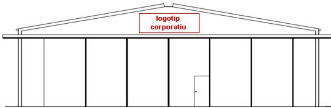
Hangars zones oest i sudoest