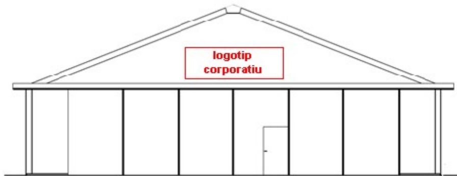
Hangars zona sud

Hangars zones Oest i Sud-oest: Situació possibles logotips corporatius