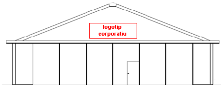
Hangars zona sud

Hangars zones Oest i Sud-oest: Situació possibles logotips corporatius