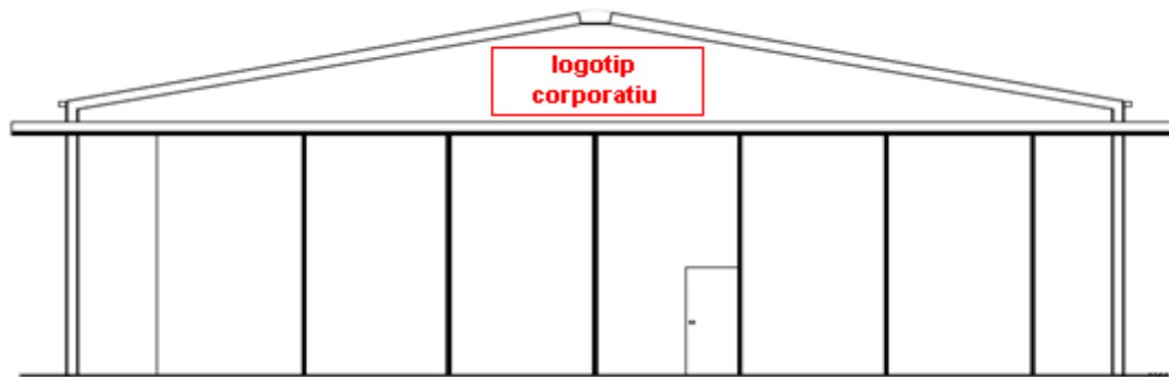
Hangars zones oest i sudoest

En cas dels hangars individuals de la zona Sud el logotip corporatiu, o d'identificació del propietari, es podrà instal·lar a les façanes que miren a la plataforma interior, entre la biga a contravents, situada damunt la porta, i la coberta. Les dimensions màximes del logotip seran de 4,00 metres d'amplada x 1,20 metres d'alçada.